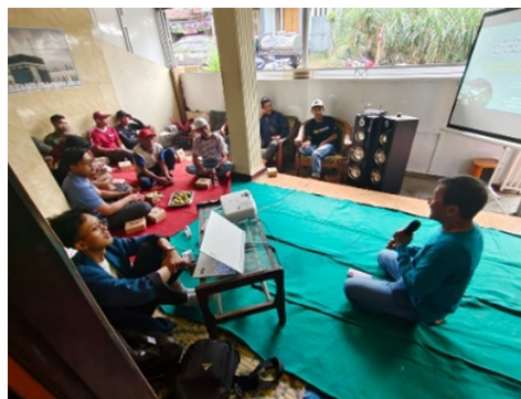
Gambar 3 Pemberian materi pelatihan di komunitas peternak Junrejo, Kota Batu.