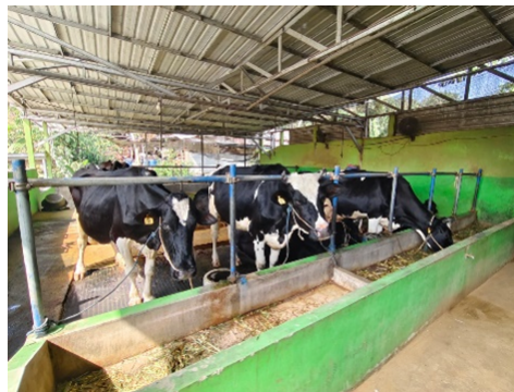
Gambar 2 Kandang sapi milik salah satu peternak Junrejo, Kota Batu.

Untuk mengidentifikasi tantangan yang dihadapi oleh komunitas peternak sapi perah di Junrejo, tim melakukan kunjungan langsung ke lokasi untuk berdialog dengan para pengrajin dan mendiskusikan masalah yang sedang terjadi (Gambar (2 )). Observasi ini melibatkan tim pelatihan dan perwakilan komunitas. Hasil observasi kemudian dibahas lebih lanjut untuk dilakukan perumusan solusi mengatasi masalah peningkatan dalam manajemen pakan ternak melalui penggunaan probiotik dan penerapan teknologi SCP dalam pakan. Setelah tema kegiatan pengabdian masyarakat ditentukan, penyusunan materi pelatihan dilakukan untuk memudahkan pemberian materi pada saat pelaksanaan kegiatan. Probiotik dan SCP yang mengandung Lactobacillus spp. , Bacillus spp. , dan Bifidobacterium bifidum diformulasi di Laboratorium Mikrobiologi, Departemen Biologi, Fakultas Sains dan Teknologi, Universitas Airlangga. Tahap terakhir adalah pelaksanaan program pengabdian masyarakat itu sendiri, yang dibagi menjadi pemberian teori tentang dasar dan manfaat probiotik dan SCP untuk ternak, dan pendampingan langsung perbanyak probiotik dan SCP serta pemberiannya ke dalam pakan ternak. Evaluasi difokuskan pemahaman mitra probiotik dan SCP untuk ternak serta kemampuan dalam memperbanyak probiotik dan SCP dari starter yang diberikan.