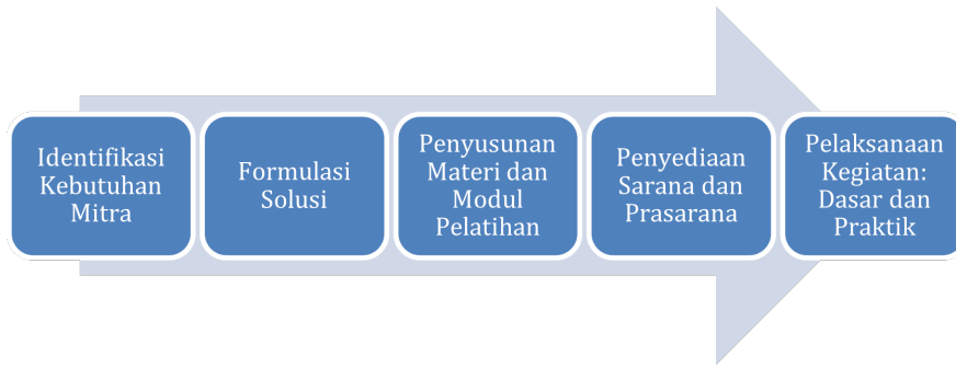
Gambar 1 Tahap-tahap kegiatan pelatihan.

Program pelatihan pembuatan dan pemberian probiotik dan SCP pada sapi perah di Komunitas Peternak Junrejo, Kota Batu dilaksanakan pada tanggal 10 Agustus 2024 di ERWE Farm , Desa Tlekung, Kecamatan Junrejo, dengan peserta dari peternak lokal di sekitarnya. Pendekatan partisipatif digunakan dalam kegiatan ini, melibatkan peternak secara langsung di setiap aktivitas. Keterlibatan langsung ini dirancang untuk memperdalam pemahaman mereka terhadap materi, sehingga mereka dapat menerapkan keterampilan dengan efektif. Inisiatif pengabdian masyarakat ini disusun dalam lima tahap yang ditunjukkan pada Gambar (1 ).