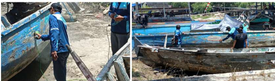
Gambar 7 Praktik Perbaikan Kapal Nelayan di Desai Gisik Cemandi Sidoarjo

Praktik perbaikan kapal nelayan dengan fiberglass dilaksanakan langsung di lokasi penambatan perahu nelayan di sekitar pelabuhan tradisional Gisik Cemandi. Salah satu kapal nelayan yang mengalami kerusakan pada lambungnya dipilih sebagai objek perbaikan. Proses dimulai dengan persiapan permukaan area yang rusak, di mana instruktur dari Departemen Teknik Perkapalan ITS menjelaskan pentingnya membersihkan bagian tersebut secara menyeluruh. Permukaan lambung kapal kemudian digerinda hingga halus untuk memastikan resin dapat menempel dengan baik [12] . Setelah itu, area yang sudah digerinda dikeringkan dengan cermat untuk memastikan tidak ada sisa air atau kelembapan, karena hal tersebut dapat mengganggu proses adhesi fiberglass . Para nelayan turut ambil bagian dalam langkah persiapan ini, sehingga mereka memahami pentingnya tahapan awal yang benar dalam memastikan kualitas hasil perbaikan lihat Gambar 7.