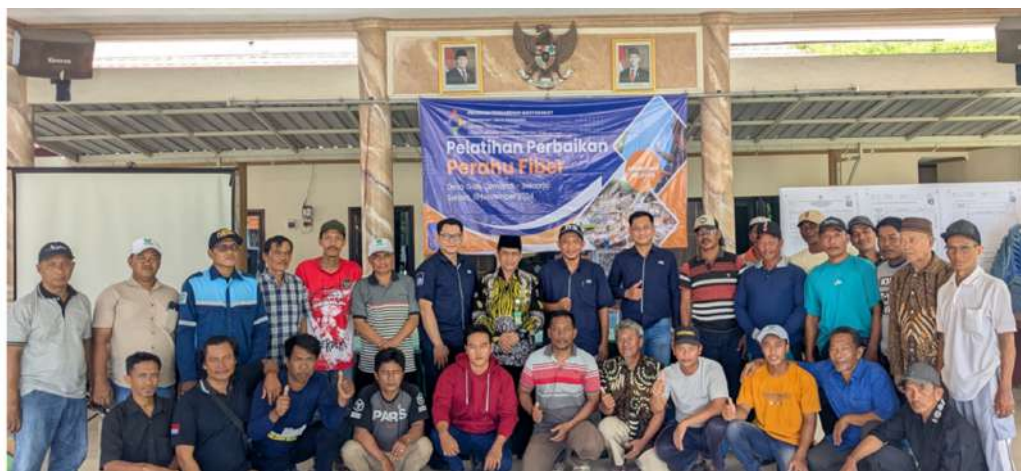
Gambar 8 Foto Bersama Peserta Pelatihan Perbaikan Perahu Kayu Dengan Laminasi Fiberglass

Nelayan menekankan pentingnya mempertimbangkan aspek kearifan lokal dalam diskusi. Mereka mengusulkan agar perbaikan dengan fiberglass tetap mempertahankan estetika dan metode tradisional yang telah lama mereka gunakan, sehingga kapal tetap sesuai dengan kebutuhan operasional mereka sehari-hari. Secara keseluruhan, tanggapan nelayan mencerminkan antusiasme untuk memanfaatkan fiberglass sebagai solusi perbaikan kapal, namun disertai dengan kebutuhan akan pendampingan teknis, pertimbangan biaya, dan adaptasi terhadap kebiasaan setempat. Hal ini menunjukkan perlunya pendekatan yang komprehensif dalam mengimplementasikan teknologi baru di kalangan nelayan tradisional lihat Gambar 8.