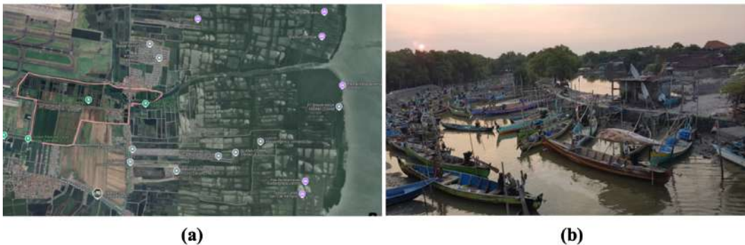
Gambar 1 (a) Peta wilayah Desa Gisik Cemandi, Sidoarjo; (b) Kondisi perahu nelayan di Desa Gisik Cemandi

Desa Gisik Cemandi, yang terletak di Kecamatan Sedati, Kabupaten Sidoarjo, Provinsi Jawa Timur, merupakan desa pesisir dengan karakteristik geodemografi yang unik. Desa ini berada di dataran rendah dengan akses langsung ke Laut Jawa, menjadikannya rentan terhadap dampak perubahan iklim, seperti banjir rob. Tata guna lahan di Desa Gisik Cemandi didominasi oleh pertanian dan tambak, yang mencakup lebih dari 65% dari total wilayah desa, sementara kawasan permukiman hanya sebesar 13,66%. Sebagian besar penduduk desa menggantungkan hidup pada sektor perikanan dan pertanian, khususnya sebagai nelayan dan petani tambak, menjadikan kedua sektor ini sebagai penopang utama perekonomian desa [6] . Desa Gisik Cemandi terbagi menjadi dua dusun, yaitu Gisik Cemandi lihat Gambar 1, dengan pola permukiman yang terkonsentrasi di sepanjang jalur akses utama. Meskipun memiliki kepadatan penduduk yang relatif sedang, tingkat pendidikan masyarakat desa ini bervariasi, dengan sebagian besar penduduk memiliki tingkat pendidikan yang cukup rendah. Hal ini menunjukkan adanya kebutuhan untuk meningkatkan akses pendidikan dan pelatihan kejuruan guna meningkatkan keterampilan dan kesejahteraan penduduk [2] .