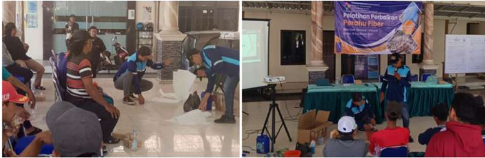
Gambar 6 Pengenalan Alat dan Bahan Untuk Pembuatan Fiberglass

Setelah penjelasan alat dan bahan, instruktur memberikan demonstrasi singkat mengenai proses pencampuran resin dan katalis dengan perbandingan yang tepat. Para nelayan diperlihatkan bagaimana bahan tersebut diaplikasikan pada permukaan kayu yang telah disiapkan sebelumnya. Demonstrasi ini bertujuan agar peserta memahami teknik dasar seperti pelapisan serat kaca, memastikan tidak ada gelembung udara yang terperangkap, dan menjaga ketebalan lapisan yang merata [11] . Suasana sesi ini sangat interaktif, dengan peserta secara aktif mengajukan pertanyaan mengenai alat dan bahan yang digunakan, serta berbagi pengalaman mereka terkait metode perbaikan tradisional yang biasa mereka lakukan.