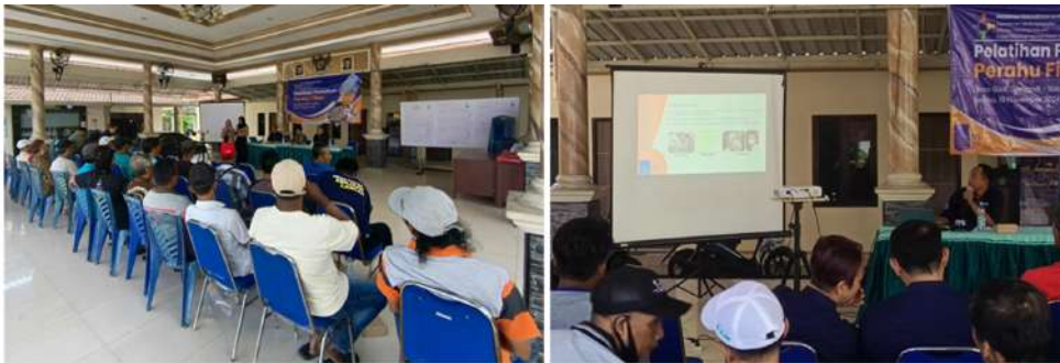
Gambar 5 Penyampaian Materi Terkait Perbaikan Perahu Kayu Dengan Laminasi Fiberglass

Presentasi materi yang mencakup dasar-dasar perawatan kapal kayu dengan bahan fiberglass dilakukan selama sehari penuh oleh dosen dari Departemen Teknik Perkapalan ITS. Materi ini bertujuan memberikan pemahaman kepada nelayan mengenai pentingnya perawatan rutin kapal untuk memperpanjang umur kapal dan menjaga kelaikannya. Dalam sesi ini, dosen menjelaskan langkah-langkah perawatan yang sederhana namun efektif, seperti membersihkan lambung kapal secara berkala, mengecat ulang untuk melindungi kayu dari air laut, serta memeriksa dan memperbaiki sambungan yang mulai longgar atau bocor lihat Gambar 5. Selain itu, teknologi fiberglass diperkenalkan sebagai solusi modern untuk memperbaiki kerusakan pada kapal kayu. Keuntungan fiberglass , seperti ketahanan terhadap air laut, daya rekat yang kuat, serta kemampuannya mencegah kerusakan akibat organisme laut, juga dijelaskan secara rinci.