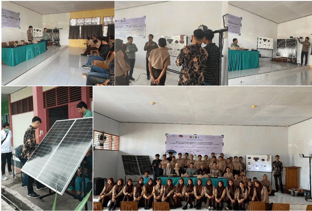
Gambar 5 Sosialisasi dan Pelatihan di Lokasi Mitra.