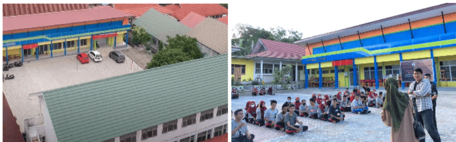
Gambar 1 Gedung SKAPAT Soppeng.

SMK Negeri 4 Soppeng (SKAPAT) merupakan salah satu SMK unggulan di Kabupaten Soppeng, Sulawesi Selatan. Didirikan pada 18 April 2005 melalui SK 154/IV/2005, sekolah ini berstatus negeri dan berada di bawah naungan pemerintah pusat. Dengan luas area 10.014 m 2 , SKAPAT Soppeng beralamat di Jalan Kayangan LR. Teratai No.121, Botto, Kecamatan Lalabata. Sebagai sekolah berbasis industri, SKAPAT memiliki visi mencetak SDM yang terampil, mandiri, produktif, dan berlandaskan iman serta takwa. Sekolah ini membuka lima Program Keahlian: Teknik Multimedia, Teknik Elektronika Industri, Teknik Kendaraan Ringan, Teknik Bisnis dan Sepeda Motor, serta Teknik Perbankan dan Keuangan Mikro. Gambar 1 menunjukkan gedung sekolah SKAPAT Soppeng.