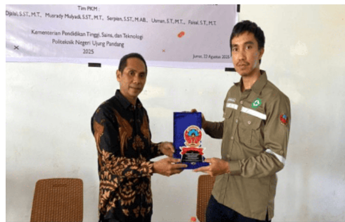
Gambar 6 Serah Terima kepada Mitra.