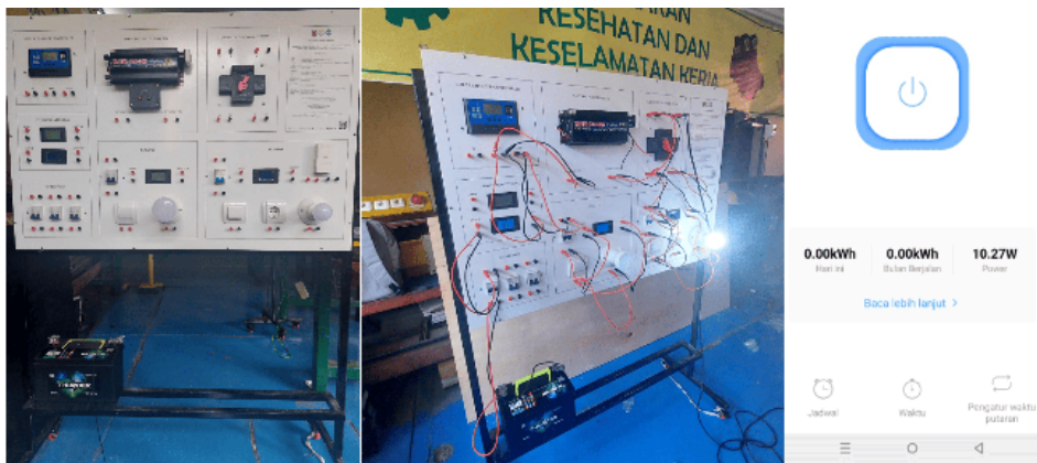
Gambar 4 Pengujian Trainer PLTS Berbasis IoT.

Sistem dinyatakan layak digunakan sebagai media pembelajaran dan memenuhi aspek keamanan serta kemudahan penggunaan. Gambar 4 menunjukkan pengujian trainer PLTS berbasis IoT.