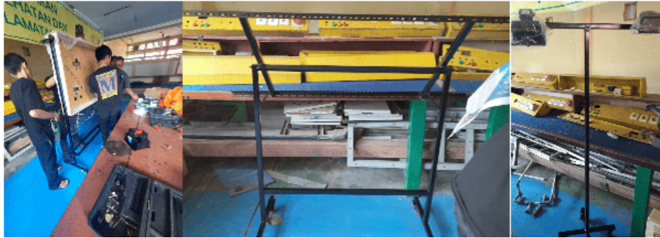
Gambar 3 Pembuatan Trainer PLTS.