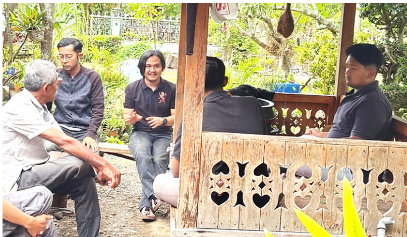
Gambar 4 FGD ( Forum Grup Discation ).

Forum diskusi ini sekaligus berfungsi sebagai wadah persiapan teknis, khususnya dalam mengidentifikasi serta mendata kebutuhan perlengkapan dan peralatan yang diperlukan selama kegiatan berlangsung. Dengan adanya pemetaan kebutuhan sejak awal, tim dapat memastikan bahwa proses kegiatan, baik latihan maupun produksi, berjalan secara efektif dan efisien. Selain itu, tahapan ini juga memperlihatkan pendekatan sistematis dalam pelaksanaan pengabdian, di mana setiap kegiatan dirancang berdasarkan data empiris serta ditunjang oleh perencanaan yang matang. Seluruh data yang telah diperoleh tidak hanya dihimpun, tetapi juga dianalisis secara sistematis menggunakan pendekatan needs assessment (analisis kebutuhan). Pendekatan ini dipandang relevan karena mampu mengidentifikasi kesenjangan antara kondisi riil di lapangan dengan kebutuhan ideal yang diperlukan dalam pelaksanaan kegiatan. Hasil analisis kemudian dijadikan dasar dalam perencanaan kerja studio, khususnya dalam penyusunan perancangan produksi video demo permainan Rapa'i. Dengan demikian, setiap keputusan yang diambil dalam forum diskusi bukan semata-mata didasarkan pada asumsi, melainkan pada data empiris yang telah diverifikasi. Hal ini sesuai dengan prinsip partisipatif dalam pengabdian masyarakat, di mana proses perencanaan dilakukan dengan melibatkan data dan masukan dari lapangan sebagai pijakan utama.