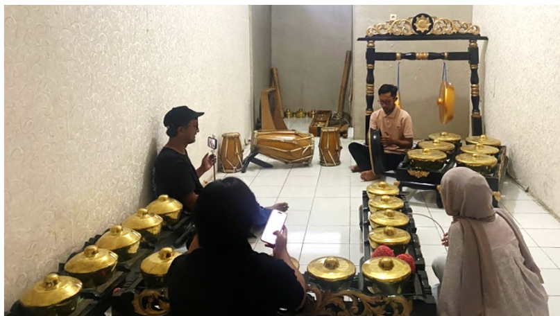
Gambar 6 Pengambilan Gambar Posisi Permainan Rapa'i .

Pada tahap ini pengambilan video difokuskan pada pengenalan posisi tubuh dan penempatan rapai saat dimainkan. Pengambilan gambar dilakukan secara detail untuk memperlihatkan posisi instrumen rapai dengan posisi permainan pemain meliputi cara memegang, posisi tangan dan kaki, serta gerakan tubuh yang selaras dengan instrumen. Pendekatan ini bertujuan agar peserta maupun penonton dapat memahami dengan jelas dasar-dasar teknik permainan rapai sebelum melangkah ke tahap yang lebih kompleks. Selain itu, sudut pengambilan gambar diatur agar setiap detail gerakan terlihat utuh, sehingga dapat dijadikan sebagai bahan ajar maupun dokumentasi yang representatif.