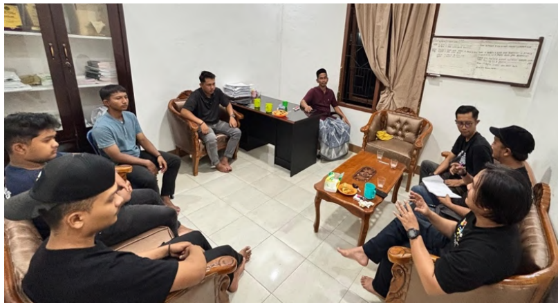
Gambar 10 Sosialisasi dengan Peserta Pelatihan Rapa'i didampingi Keuchik .

Hasil sosialisasi diperoleh beberapa kesepakatan penting, antara lain: penetapan jadwal latihan secara reguler, kesiapan peserta dalam mengikuti seluruh rangkaian kegiatan, serta komitmen mitra untuk mendukung penyediaan sarana dan prasarana yang dibutuhkan. Selain itu, peserta menunjukkan antusiasme yang tinggi, ditandai dengan kesediaan mereka untuk aktif berlatih dan menjaga kedisiplinan sesuai aturan yang telah ditetapkan. Dengan adanya sosialisasi ini tercipta suasana kebersamaan antara tim pengabdian, mitra, dan peserta. Hal ini sekaligus menjadi titik awal dimulainya persiapan latihan, dimana setiap pihak sudah memahami perannya, merasa memiliki program, serta siap untuk bekerja sama dalam mendukung kelancaran pelatihan seni tradisi rapa'i di Gampong Miruk.