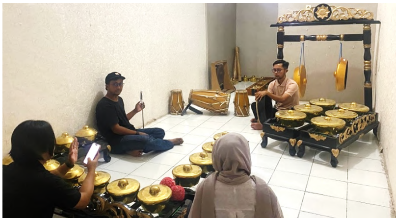
Gambar 7 Pengambilan Gambar Pola Bunyi Rapai.

Selain perekaman suara naratif, dilakukan pula perekaman musik dengan menggunakan instrumen tradisional. Kehadiran musik ini berfungsi sebagai pengiring yang mampu membangun suasana, sekaligus memperkuat pesan visual dalam video. Dengan demikian, kombinasi suara narasi dan musik instrumen menciptakan pengalaman audiovisual yang lebih hidup, komunikatif, dan menarik untuk disimak.