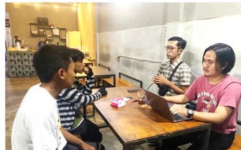
Gambar 2 FGD ( Forum Grup Discussion ).