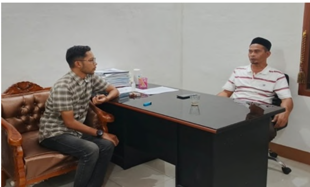
Gambar 3 Pertemuan dengan Keuchik Gampong Miruk.

Selanjutnya, setelah diskusi yang dilakukan bersama mengenai jadwal latihan yang telah disepakati, Keuchik menyampaikan daftar nama peserta yang akan terlibat dalam pelatihan rapa'i di Gampong Miruk. Peserta yang ditunjuk mayoritas berasal dari kalangan pemuda yang selama ini dikenal aktif dalam berbagai kegiatan gampong. Proses penentuan peserta ini tidak dilakukan secara sepihak, melainkan melalui mekanisme informasi terbuka yang sebelumnya telah disampaikan Keuchik kepada masyarakat melalui perangkat gampong. Dengan cara tersebut, kesempatan untuk mengikuti pelatihan dapat diakses oleh seluruh warga yang berminat dan memiliki komitmen terhadap kegiatan. Dari proses penjangkaran tersebut, diperoleh enam orang pemuda yang bersedia sekaligus dinyatakan siap untuk mengikuti pelatihan rapa'i . Kehadiran mereka mencerminkan adanya semangat partisipasi generasi muda dalam mendukung kegiatan pengabdian, sekaligus menunjukkan kepedulian terhadap pelestarian seni tradisi lokal. Enam peserta ini diharapkan menjadi motor penggerak yang tidak hanya berperan selama kegiatan berlangsung.