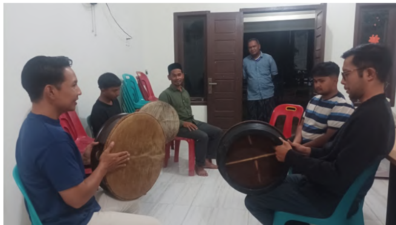
Gambar 14 Latihan Komposisi Rapa'i Sederhana.

Dengan demikian proses pelatihan Rapa'i di Gampong Miruk menggunakan model pembelajaran meliputi discovery learning , experiential learning dan Cognitive learning .