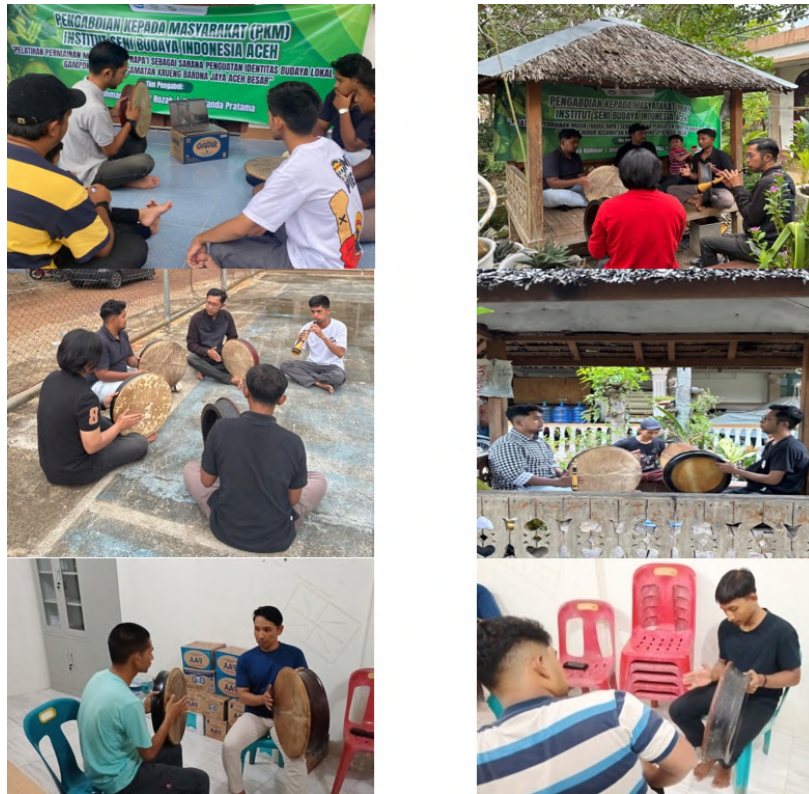
Gambar 13 Proses Latihan Rapa'i.