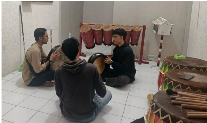
Gambar 5 Penyusunan Pola Bunyi Rapai.

Pada tahap ini tim pengabdian merumuskan pola bunyi rapai yang nantinya akan dipelajari oleh peserta latihan. Penyusunan pola rapai berawal dari pemahaman tiga pola dasar, yaitu (1) bum , (2) preung , dan (3) chik . Pola bum merupakan pukulan berat dengan bunyi rendah yang berfungsi sebagai penanda utama ritme. Pola preung menghasilkan bunyi sedang dengan tekanan lebih ringan dan tegas dengan intensitas lebih besar, biasanya dipakai sebagai penghubung atau pengisi antar ketukan. Sementara itu, pola chik menghadirkan kecil dan singkat yang berfungsi sebagai aksentuasi untuk memperkuat dinamika permainan. Ketiga pola ini menjadi dasar penting yang harus dikuasai sebelum mempelajari pola rapai yang lebih kompleks.