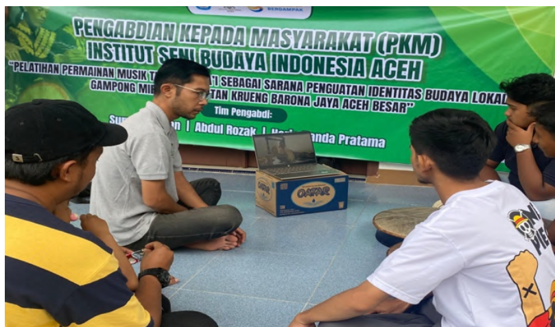
Gambar 11 Menonton Video Pembelajaran.

Setelah menyimak video pembelajaran peserta diberi kesempatan untuk mempraktikkan secara perlahan tahapan permainan rapa'i yang ditampilkan. Proses menonton dan menirukan secara berulang menjadi strategi sederhana namun efektif dalam membantu peserta menguasai keterampilan bermain rapa'i . Keunggulan lain dari video pembelajaran ini adalah sifatnya yang fleksibel, karena dapat diakses dan dipelajari peserta di luar sesi latihan formal. Dengan demikian, peserta dapat berlatih secara mandiri di rumah maupun secara berkelompok. Kehadiran video pembelajaran tidak hanya berfungsi sebagai media penunjang latihan, tetapi juga menjadi sarana memperluas akses belajar. Peserta memiliki peluang untuk mengulang materi sebanyak yang diperlukan sesuai dengan kecepatan belajar masing-masing. Hal ini menunjukkan bahwa video pembelajaran berperan penting dalam mendukung keberlangsungan pelatihan rapa'i di Gampong Miruk, sekaligus memperkuat daya guna program pengabdian agar hasilnya dapat bertahan lebih lama di tengah masyarakat.