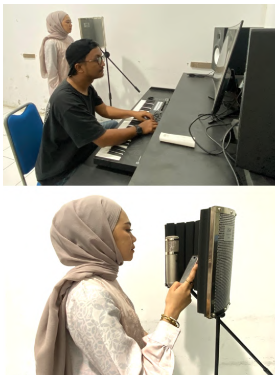
Gambar 8 Pengambilan Back Voice dan Instrumen.

Proses perekaman suara dilakukan menggunakan aplikasi Studio One Versi 6. Aplikasi ini dipilih karena memiliki fitur yang memadai untuk menghasilkan kualitas rekaman yang jernih dan seimbang. Melalui pengaturan teknis yang tepat, hasil rekaman dapat diperdengarkan secara jelas, tanpa gangguan, serta sesuai kebutuhan pembelajaran. Dengan adanya pengolahan audio ini, peserta maupun penonton dapat memperoleh penjelasan yang lebih komprehensif, sekaligus menikmati alunan musik pengiring yang memperkaya nilai estetis dari video yang dihasilkan.