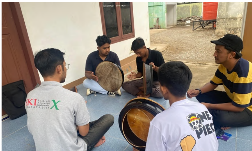
Gambar 12 Posisi permainan Rapa'i .

Pola bum merupakan pukulan dasar dengan menghasilkan bunyi yang berat, dalam, dan bergema. Bunyi ini dihasilkan dengan memukul bagian tengah membran rapa'i menggunakan telapak tangan yang terbuka. Pola bum biasanya berfungsi sebagai penanda tempo dasar serta memberikan aksen kuat pada awal atau akhir frase irama.