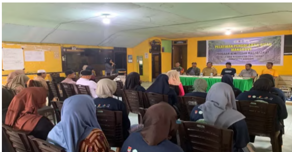
Gambar 6 Pembukaan Pelatihan.