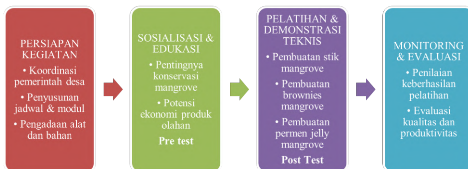
Gambar 2 Diagram Alur Pelaksanaan Pengabdian Masyarakat di Desa Rata.

Kegiatan pelatihan ini dilaksanakan pada tanggal 2-3 Agustus tahun 2024, yang dilaksanakan di desa Rata Kecamatan Toili Barat Kabupaten Banggai Propinsi Sulawesi Tengah. Pelaksana kegiatan ini adalah tim pemberdayaan Universitas Muhammadiyah Luwuk bersama kelompok mitra Sikarimanang. Nama Pelatihan pengolahan produk berbahan baku buah mangrove yang diolah menjadi Stik, Brownies dan Permen jeli.