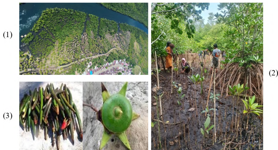
Gambar 1 (1) Suasana Mangrove Tampak dari Atas; (2) Aktivitas Kelompok di Hutan Mangrove; (3) Buah Mangrove yang digunakan dalam Pembuatan Produk.

Permasalahan yang dihadapi oleh masyarakat desa Rata Kecamatan Toili Barat adalah selama ini 70% masyarakat bergantung pada Penangkapan ikan, dengan pendapatan rata-rata Rp 1-2 juta/bulan. Ancaman lingkungan berupa abrasi pantai, akibat banyaknya penebangan hutan mangrove untuk keperluan bangunan rumah maupun sebagai kayu bakar, sehingga kehilangan hutan mangrove dari 45 ha menjadi saat ini 12 ha. Oleh sebab itu perlu dilakukan pendampingan untuk pemanfaatan hutan mangrove yang ramah lingkungan dan dapat meningkatkan pendapatan masyarakat. Saat ini desa Rata telah memiliki kelompok yang bergerak untuk rehabilitasi, rintisan ekowisata dan pemanfaatan bahan pangan dari hasil hutan mangrove. Kelompok yang terbentuk bernama “Sikarimanang” dalam Bahasa Bajo yang berarti “Saling Menyayangi” beranggotakan 15 orang yang merupakan wanita atau istri-istri nelayan. Kelompok ini belum dapat memanfaatkan dengan baik terkait hasil hutan mangrove dari buah dan daun. Sebab minimnya pengetahuan masyarakat (kelompok) yang mengetahui bahwa buah dan daun mangrove dapat dimanfaatkan untuk meningkatkan pendapatan dengan mengolahnya menjadi produk makanan seperti stik buah mangrove [8] , brownies buah mangrove [9] dan permen jeli buah mangrove [10] . Suasana dan aktivitas hutan mangrove di Desa Rata dapat dilihat pada gambar 1.