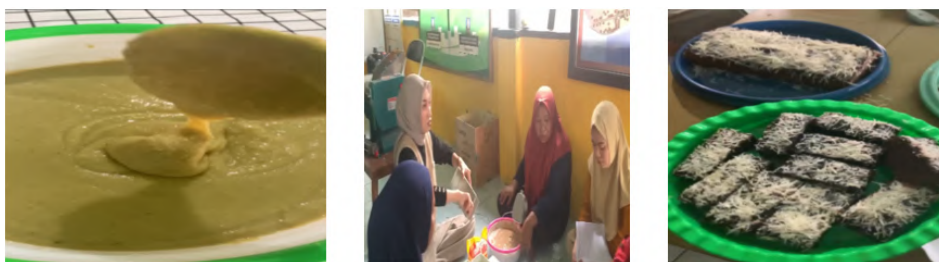
Gambar 4 Proses pembuatan dan Brownies Mangrove.

Wadah baskom dimasukkan 3 butir telur, 120 g gula dan setengah sendok teh emulsifier , lalu dicampur dengan alat mixer selama 30 menit pada kecepatan 3 hingga terbentuk adonan yang mengembang dan ditambahkan 75 gr tepung terigu dan 38 gr susu bubuk sambil diayak, ditambahkan garam secukupnya lalu adonan diaduk hingga rata. Setelah itu, ditambahkan minyak nabati dan cokelat putih yang telah dilelehkan sebelumnya, kemudian diaduk secara merata. Selanjutnya ditambahkan 120 mL pasta/bubur buah mangrove ke dalam adonan, diaduk dan ditambahkan 6 tetes pewarna makanan berwarna hijau tua lalu aduk kembali hingga adonan tercampur secara merata. Adonan yang sudah jadi dituang ke dalam loyang berbentuk persegi empat panjang dengan ukuran 18x19x6 cm dan dikukus selama 35 menit di dalam dandang yang telah dipanaskan sebelumnya. Kematangan brownies dicek dengan ditusuk menggunakan tusukan sate, jika adonan sudah matang segera angkat loyang dan didinginkan selama 15-20 menit pada suhu ruang. Brownies kukus kemudian dikeluarkan dari loyang dan siap ditambah topping berupa butter cream dan parutan keju di atasnya.