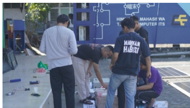
Gambar 4 Pengujian Fungsional terhadap Sistem.

Setelah proses perancangan dan pembuatan/ wiring alat selesai maka dilakukan pengujian sistem Solar Freezer . Pengujian ini dilakukan untuk mengetahui apakah sistem sudah bekerja dengan baik atau masih terdapat beberapa faktor error pada sistem. Pengujian fungsional ini memperoleh keberhasilan setelah dilakukan beberapa percobaan dan hasil yang didapatkan adalah sistem dapat berhasil bekerja dengan normal.