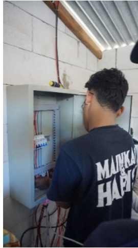
Gambar 5 Pemasangan Alat di Lokasi Abmas.

Setelah Pengujian fungsional sistem dapat bekerja dengan normal dan baik maka selanjutnya sistem dapat di installasi langsung dilokasi abdimas. Proses installasi Solar Freezer system ini berlangsung selama satu hari yaitu pada tanggal 3 Agustus 2024. Dengan fokus kegiatan pada instalasi mulai dari pemasangan rangka panel surya dan wiring Solar Freezer system . Setelah semua proses installasi selesai dilakukan maka dilakukan pengecekan terhadap wiring system agar tidak terjadi error atau hal yang tidak diinginkan pada sistem nantinya ketika dihidupkan.