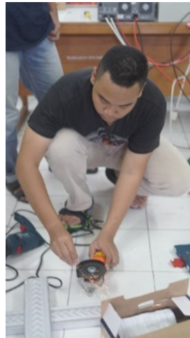
Gambar 3 Perancangan dan pembuatan Solar Freezer .

Pembuatan sistem solar freezer dilakukan setelah desain mekanik dan spesifikasi elektris selesai. Pembuatan alat ini memakan waktu kurang lebih satu bulan dengan rincian 2 minggu awal digunakan untuk pembelian alat dan barang yang akan digunakan, dilanjutkan dengan proses wiring komponen elektrikal pada 2 minggu berikutnya.