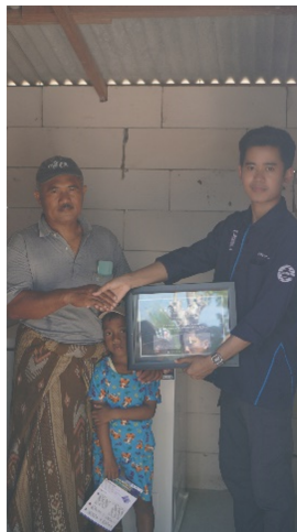
Gambar 6 Penyerahan Sistem Solar Freezer kepada Mitra.

Setelah pengecekan wiring selesai maka keesokan harinya pada tanggal 4 Agustus 2024 dilakukan penyuluhan sekaligus penyerahan sistem Solar Freezer kepada mitra. Sebelum penyuluhan, dilakukan percobaan power on system dan diperoleh hasil bahwa sistem dapat beroperasi secara normal dan baik. Penyuluhan kepada mitra dilakukan dengan menjelaskan fungsi dari setiap peralatan dan cara mengoperasikan sistem. Setelah penyuluhan selesai dan mitra sudah memahami tahapan pengoperasian sistem maka dilakukan penyerahan sistem Solar Freezer kepada mitra.