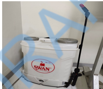
Gambar 2 Tangki sprayer pertanian.

Sprayer pertanian merupakan alat yang digunakan untuk mengaplikasikan pestisida, yang sangat penting dalam upaya pemberantasan dan pengendalian hama serta penyakit pada tanaman. Alat ini dirancang khusus untuk menyemprotkan pestisida secara efektif ke area yang terinfestasi [4] . Dalam hal ini, sprayer akan diintegrasikan dengan drone untuk melakukan penyemprotan.