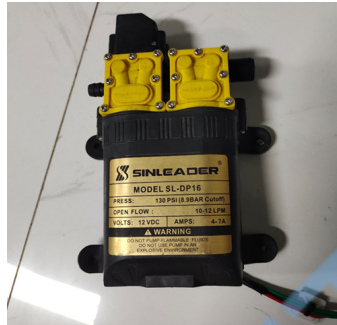
Gambar 3 Pompa air DC 12 V.

Pompa air adalah alat yang digunakan untuk memindahkan air dari satu lokasi ke lokasi lain melalui mekanisme mekanis atau elektrik. Di Indonesia, pompa air memiliki peran penting dalam berbagai sektor, termasuk pertanian, rumah tangga, dan industri. Teknologi pompa air terus berkembang dengan fokus pada peningkatan efisiensi, keberlanjutan, dan penyesuaian dengan kondisi lokal. Pompa air DC adalah jenis pompa yang menggunakan motor DC dan tegangan searah sebagai sumber tenaganya. Dengan memberikan beda tegangan pada kedua terminal tersebut, motor akan berputar ke satu arah, dan jika polaritas dari tegangan tersebut dibalik, arah putaran motor juga akan terbalik. Polaritas tegangan yang diberikan pada kedua terminal menentukan arah putaran motor, sedangkan besar beda tegangan pada kedua terminal menentukan kecepatan motor [8] .