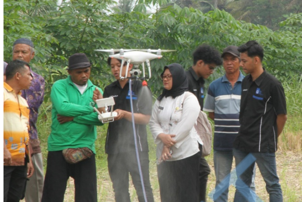
Gambar 7 Tahap demonstrasi.

Respon masyarakat terhadap demonstrasi alat menunjukkan antusiasme yang cukup tinggi. Banyak dari warga yang menunjukkan ketertarikan dan mengajukan pertanyaan detail mengenai spesifikasi dan cara kerja dari drone penyemprot pestisida ini. Tak hanya mengajukan pertanyaan beberapa masyarakat dan petani ikut turut mencoba mengoperasikan drone yang dipandu oleh tim pengabdian masyarakat dari Laboratorium Simulasi Sistem Tenaga Listrik. Performa alat saat demonstrasi juga berjalan dengan sangat memuaskan, drone dapat terbang dan mengangkat selang dengan baik serta remot kontrol drone mampu mengatur laju drone dengan stabil. Sprayer pestisida dan pipa nozzle juga dapat beroperasi menyemprotkan cairan pestisida secara merata.