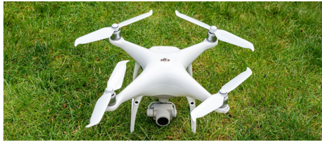
Gambar 1 Drone DJI Phantom 4 Pro.

Drone jenis ini menggunakan baling-baling ( propellers ) untuk terbang dengan memanfaatkan gaya angkat yang dihasilkan dari putaran motor yang terpasang. Drone ini memiliki keunggulan yakni lebih stabil dan daya angkut lebih untuk mengangkat beban yang cukup berat. Semakin banyak propeller yang digunakan pada drone ini, tentu akan lebih stabil dan lebih aman [3] .