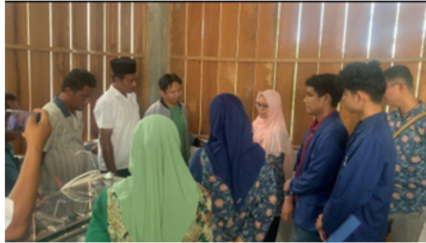
Gambar 6 Sosialisasi program.

Sosialisasi program dilaksanakan kepada mitra Eduwisata Garam Mutiara Saghara yang bertujuan untuk memberikan pemahaman tentang penerapan Teknologi Tepat Guna (TTG) hasil karya tim yang dirancang dengan memanfaatkan energi panas matahari untuk memanaskan air garam hingga membentuk kristal garam. Selanjutnya air hasil evaporasi ditampung dan diproses lebih lanjut dengan menggunakan teknologi reverse osmosis (RO) yang dilengkapi dengan teknologi ultra violet (UV) untuk membunuh bakteri dan virus, sehingga air tersebut dapat dikonsumsi.