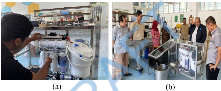
Gambar 4 (a) Proses merangkai sistem RO; (b) Proses merangkai alat desalinasi air laut.