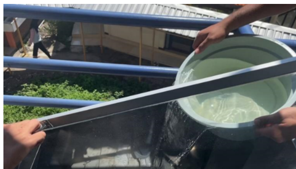
Gambar 5 Simulasi alat evaporator .

Kegiatan Simulasi alat dilakukan pada bulan Juli-Agustus 2024. Pada kegiatan ini, dilakukan pengujian alat evaporasi dan alat reverse osmosis (RO). Pengujian diawali dengan pengujian evaporator untuk mengetahui berapa lama proses evaporasi. Selanjutnya dilakukan pengujian alat reverse osmosis . Pada tahap pengujian perangkat ditemukan bahwa perangkat dapat beroperasi secara normal sesuai fungsi yang diharapkan.