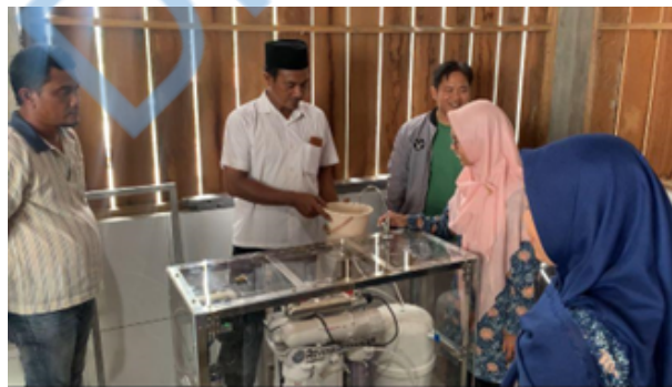
Gambar 7 Percobaan penggunaan alat Water Reverse Osmosis .

Sebelum program pengabdian masyarakat berjalan maka perlu dilakukan sosialisasi program kepada mitra terkait sistem integrasi desalinasi air laut dan sistem produksi garam modern yang akan diterapkan. Kegiatan sosialisasi dilakukan pada hari Rabu, 7 Agustus 2024. Pada kegiatan sosialisasi ini terlihat antusiasnya mitra dengan memberikan pertanyaan dan masukan kepada tim pengabdian. Pelaksanaan pendampingan mitra dilaksanakan secara langsung, diawali dengan memberikan pengarahan terhadap cara penggunaan alat dan mekanisme kerja alat hingga penerapannya yang nantinya akan dilanjutkan sebagai sistem program berkelanjutan. Dengan pendampingan yang berkelanjutan ini, diharapkan mitra dapat mengoptimalkan serta memaksimalkan produksi garam dan memanfaatkan air desalinasi untuk dapat dikonsumsi di Eduwisata Garam Mutiara Saghara.