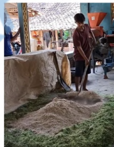
Bahan tambahan diratakan