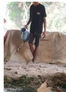
Diberikan larutan molase