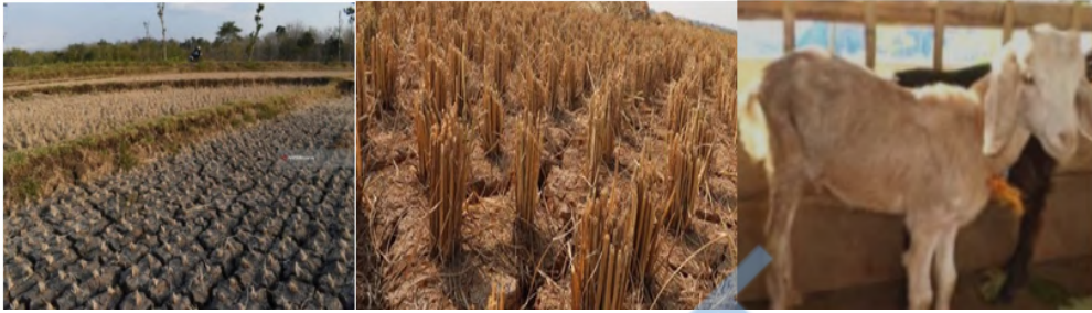
Gambar 1 Kondisi pada saat musim kemarau, serba kering dan ternak menjadi kurus.

Berada di daerah dataran tinggi seluas 2.227 Ha, Desa Cermo terdiri dari lima dusun, yaitu: Cermo, Koripan, Bodowaluh, Dolog dan Poleng, Kecamatan Kare, Kabupaten Madiun, Jawa Timur, khususnya daerah Cermo mempunyai berbagai varietas komoditas yang sangat beragam. Buah Durian, Jagung hingga Kelapa dengan mudah dapat ditemukan di kawasan ini. Apalagi padi, sangat luas terbentang menghijau pada saat musim penghujan. Kondisi berbalik pada saat musim kemarau, persawahan dan hijauan berubah menjadi kering kerontang dan bahkan merekah tanah persawahan saking keringnya dan tidak ada air sama sekali. Keadaan ini berdampak langsung pada peternakan: kurus, kurang makan, bahkan kurang gizi dan beberapa berpenyakit. Gambaran kondisi mitra disajikan pada Gambar (1 ) dan Gambar (2 ) berikut.