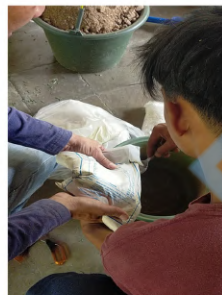
Ditambahkan Mineral tambahan