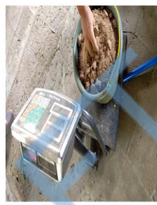
Penimbangan dedak padi