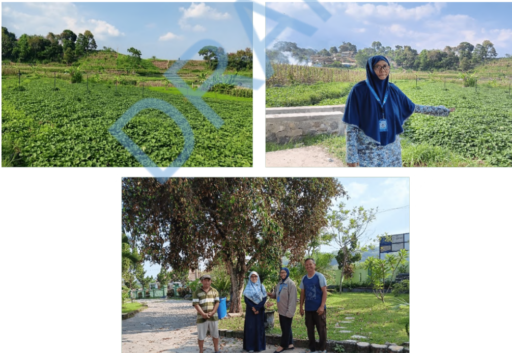
Gambar 2 Kondisi pada musim penghujan, banyak makanan ternak hijau.

Dampak kekurangan pakan pada ternak ini sangat mengganggu kesehatan dan produktivitas, bahkan sangat mempengaruhi daya tahan kekebalan tubuh hewan. Penurunan asupan pakan atau nutrisi pada ternak dapat berakibat fatal pada pasokan energi dalam tubuh ternak serta mendorong terjadinya kehilangan massa otot dan bobot badan serta negative energy balance ; lebih parah lagi dapat terjadi penurunan skor kondisi tubuh ternak [1][2] .