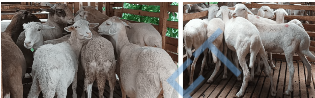
Gambar 7 Ternak yang diberikan Pakan Fermentasi jauh lebih sehat dan mempunyai bobot hidup lebih berat.

Ternak yang diberikan pakan fermentasi mengalami peningkatan bobot hidup yang cukup signifikan dibandingkan bobot sebelumnya. Pada usia yang sama ternak berbobot 10 kg dan yang diberikan pakan fermentasi mempunyai bobot hidup hingga 24,5 kg seperti ditunjukkan dalam Gambar (7) berikut.