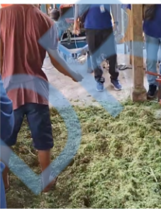
Vitamin tambahan dan mineral tambahan di taburkan di atas bahan yang telah di cacah