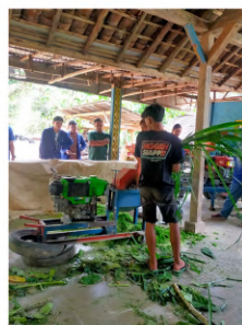
Pencacahan bahan baku hijauan

Hasil yang didapat dari kegiatan ini adalah terbukanya pola pikir masyarakat terhadap pentingnya pengolahan pakan ternak alami secara mandiri serta menyadari ketersediaan pakan ternak hijau yang terbatas. Masalah ini dihadapi oleh beberapa peternak khususnya pada musim kemarau. Perkembangbiakan ternak yang tidak baik akan menambah beban peternak dalam mencari pakan yang cukup sesuai kebutuhan ternak. Oleh sebab itu, dalam pengabdian masyarakat ini dilakukan untuk menyelesaikan permasalahan kebutuhan pakan ternak.