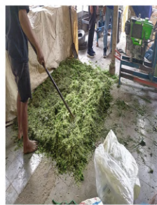
Pemadatan untuk mengeluarkan udara yang terperangkap