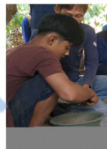
Pemberian vitamin tambahan