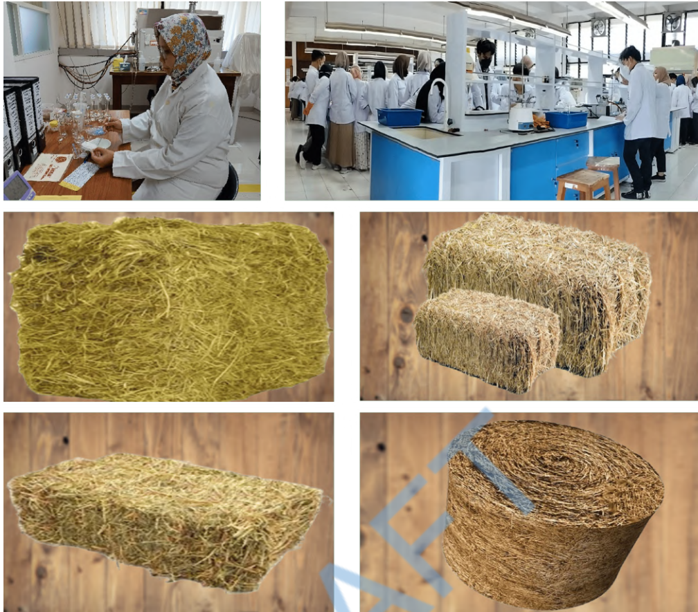
Gambar 3 Pakan Ternak yang telah berhasil dibuat dengan metode fermentasi.