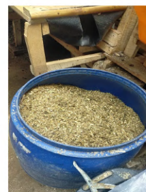
Hasil jadi pakan ternak fermentasi