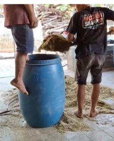
Pemasukan bahan ke dalam tong