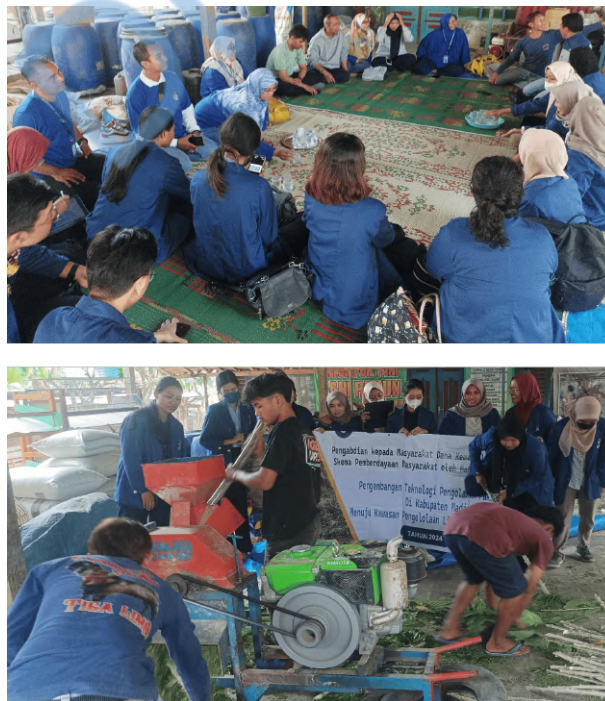
Gambar 6 Pendampingan dan kebersamai mitra membuat Pakan Ternak Fermentasi.

Di sisi lain, keberlangsungan kualitas ternak sangat dipengaruhi oleh Pakan Ternak. Salah satu cara untuk mengatasi kekurangan hijauan dimusim kemarau yaitu dengan cara pembuatan fermentasi ini. Melalui metode fermentasi ini hijauan segar yang disimpan dalam kondisi kedap udara ( anaerob ) dalam tempat yang disebut silo, hasilnya bisa disimpan tanpa merusak zat gizi di dalamnya. Fermentasi merupakan suatu teknologi yang tepat yang bertujuan untuk penyimpanan pakan tanpa merusak bahan pakan itu sendiri [4][3] . Metode Fermentasi sangat sesuai untuk menstabilkan stok pakan ternak [6] . Sementara untuk pembuatan silase menjadi pakan fermentasi ini, memberikan kemudahan supaya para peternak bisa membuat pakan tanpa harus mencari rumput setiap hari. Apalagi kalau di musim kemarau dimana hijauan terbatas, sehingga metoda silase ini bisa menjadi alternatif untuk pemberian makan serta lebih menjamin ketersediaan pakan ternak. Apalagi dari sisi nutrisinya, penambahan bakteri baik sangat bagus untuk membantu metabolisme pencernaan ternak ruminansia dan hasil uji pada umumnya menunjukkan bahwa hampir semua ternak menyukai silase atau bentuk pakan fermentasi ini [11] .