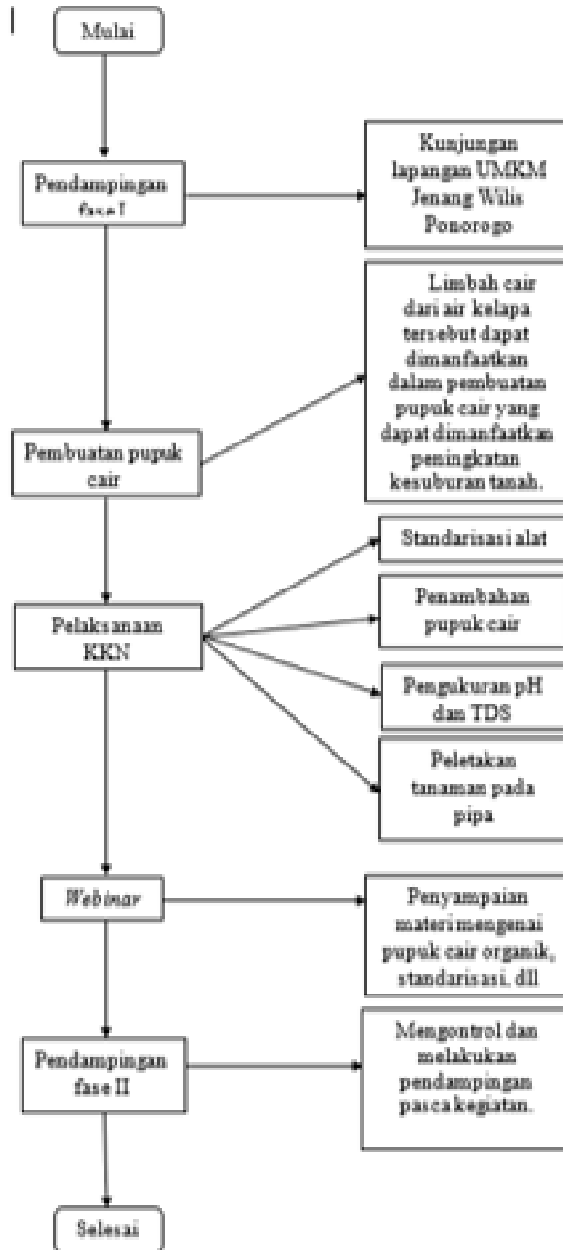
Gambar 5 Alur Kegiatan Abmas-KKN.

Kegiatan pendampingan fase II ini merupakan kegiatan pasca pengabdian kepada masyarakat (abmas). Aktifitas ini bertujuan guna mengontrol dan melakukan pendampingan mitra untuk memanfaatkan air kelapa tua, dimana diharapkan mitra dapat mengimplementasikan pengetahuan untuk memproduksi POC secara mandiri (Gambar 5 ).