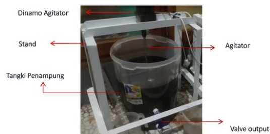
Gambar 1 Bioreaktor yang digunakan.

Peralatan yang dibutuhkan berupa bioreaktor, seperti yang ditunjukkan pada Gambar 1 .