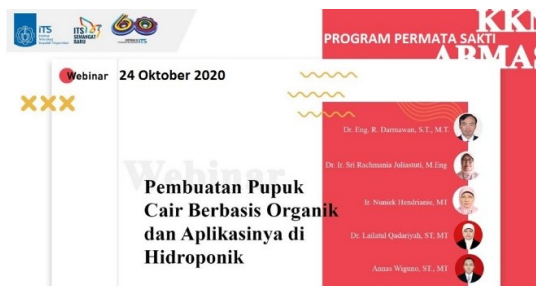
Gambar 3 Flyer Webinar dengan pemateri Tim Abmas.

dosen. Kegiatan workshop dilaksanakan pada tanggal 24 Oktober 2020 dilakukan secara daring melalui zoom meeting. Kegiatan webinar diisi dengan beberapa materi meliputi sterilisasi alat, dasar mikrobiologi dan peran mikroorganisme dalam pembuatan pupuk, pemanfaatan limbah organik untuk pembuatan pupuk cair, pengantar pupuk organik dan pupuk hayati, pembuatan pupuk cair berbasis organik dan uji coba pada tanaman, pengenalan hidroponik, faktor-faktor yang berpengaruh pada pengujian tanaman hidroponik, studi kasus dan aspek ekonomi hidroponik, serta protokol kesehatan terkait dengan pencegahan covid-19. Sehingga dengan adanya webinar (Gambar 3 dan Gambar 4 ) ini diharapkan peserta dapat memahami dengan baik mengenai pemanfaatan limbah organik dalam pembuatan pupuk cair yang digunakan pada tanaman hidroponik. Selain pemberian materi oleh pembicara, kegiatan webinar tersebut diiringi dengan “game quizziz”.