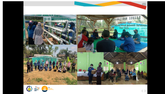
Gambar 2 Kegiatan Abmas KKN secara offline .

dosen. Kegiatan workshop dilaksanakan pada tanggal 24 Oktober 2020 dilakukan secara daring melalui zoom meeting. Kegiatan webinar diisi dengan beberapa materi meliputi sterilisasi alat, dasar mikrobiologi dan peran mikroorganisme dalam pembuatan pupuk, pemanfaatan limbah organik untuk pembuatan pupuk cair, pengantar pupuk organik dan pupuk hayati, pembuatan pupuk cair berbasis organik dan uji coba pada tanaman, pengenalan hidroponik, faktor-faktor yang berpengaruh pada pengujian tanaman hidroponik, studi kasus dan aspek ekonomi hidroponik, serta protokol kesehatan terkait dengan pencegahan covid-19. Sehingga dengan adanya webinar (Gambar 3 dan Gambar 4 ) ini diharapkan peserta dapat memahami dengan baik mengenai pemanfaatan limbah organik dalam pembuatan pupuk cair yang digunakan pada tanaman hidroponik. Selain pemberian materi oleh pembicara, kegiatan webinar tersebut diiringi dengan “game quizziz”.