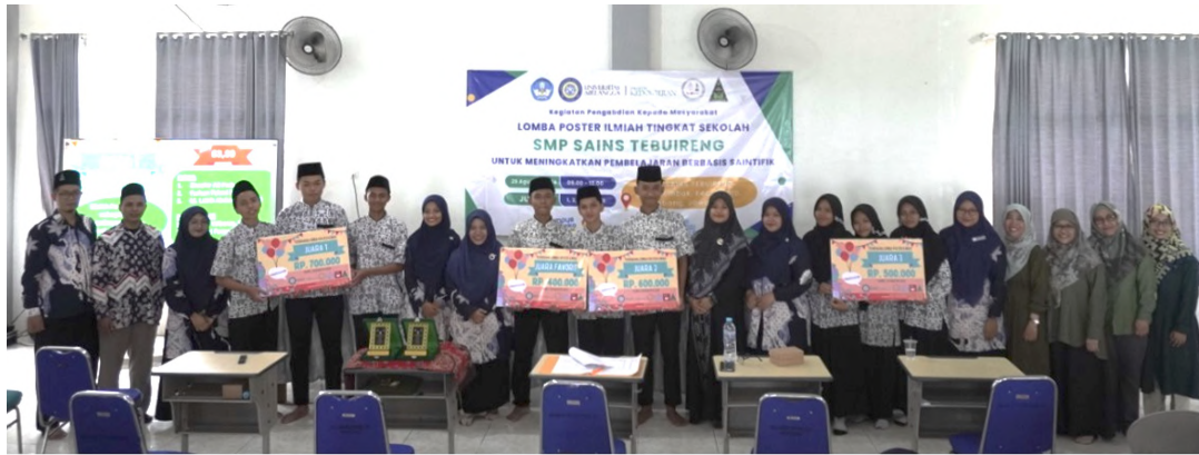
Gambar 4 Dokumentasi Lomba Poster Ilmiah