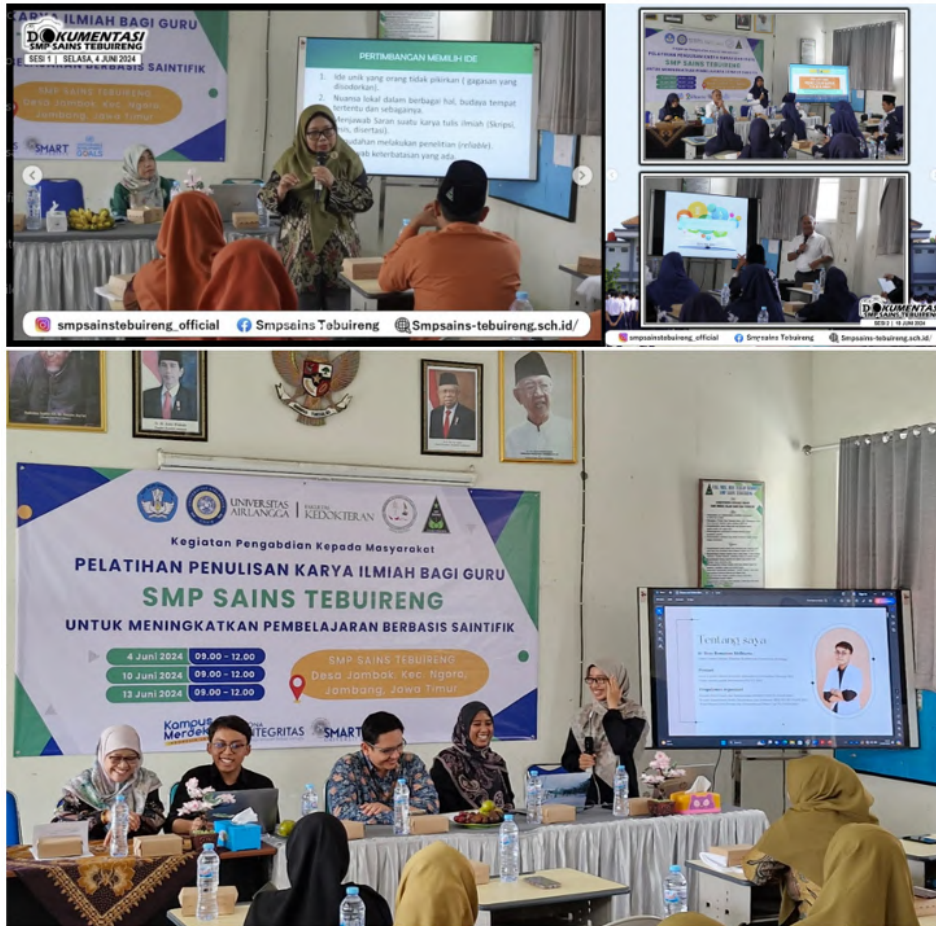
Gambar 2 Dokumentasi Pelatihan Penulisan Karya Ilmiah