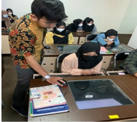
Gambar 3 Pelatihan tools atau software publish or perish .

Pelatihan penggunaan tools atau software publish or perish dan mendeley dimana peserta kegiatan dalam hal ini mahasiswa Fakultas Ekonomi dan Bisnis (FEB) IIB Darmajaya diberi pemahaman mengenai software tersebut kemudian diberikan praktik langsung mulai dari proses penginstalan sampai dengan penyimpanan data dalam penggunaan software publish or perish dan mendeley. Diketahui bahwa kedua software tersebut sangat membantu dalam proses pembuatan karya ilmiah terutama dalam mencari referensi dan rujukan daftar pustaka. Berikut hasil kegiatan pegabdian yang didokumentasikan pada kegiatan yang dilakukan: