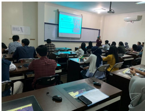
Gambar 1 Pelatihan mengenai kaidah penulisan tugas akhir atau skripsi.

Pelatihan mengenai kaidah penulisan tugas akhir atau skripsi dilakukan bertujuan untuk memberi pemahaman kepada peserta dalam hal ini mahasiswa yang ada di Fakultas Ekonomi dan Bisnis (FEB) mengenai kaidah kaidah penulisan ilmiah. Beberapa hal disampaikan dalam pelatihan ini dimana peserta harus memperhatikan sistematika dan dalam penulisan karya ilmiah. Berikut dokumentasi hasil kegiatan yang dilakukan dalam kegiatan penulisan tugas akhir atau skripsi: