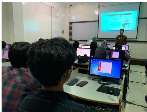
Gambar 2 Pelatihan pemilihan jurnal referensi yang relevan dengan topik penelitian.

Pelatihan mengenai pemilihan jurnal referensi yang relevan dengan topik penelitian diberikan kepada peserta dengan tujuan peserta atau mahasiswa yang mengikuti pelatihan ini memiliki kemampuan untuk memilih jurnal referensi yang tepat. Pemilihan jurnal referensi yang relevan, peserta di ajarkan untuk mencari jurnal jurnal yang memang ada kaitannya dengan variabel-variabel yang sesuai dengan penelitian yang dalam hal ini tugas akhir atau skripsi. Berikut dokumentasi kegiatan dalam pelatihan pemilihan jurnal referensi yang relevan dengan topik penelitian: