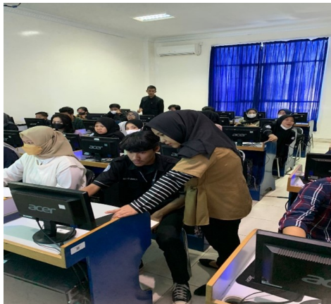
Gambar 4 Pelatihan tools atau software mendeley .

Secara keseluruhan kegiatan pengabdian yang dilakukan berjalan dengan lancar tanpa kendala apapun sesuai dengan perencanaan kegiatan pengabdian. Peserta dalam hal ini mahasiswa Fakultas Ekonomi dan Bisnis (FEB) dari prodi manajemen maupun prodi akuntansi sangat antusias mengikuti seluruh rangkaian kegiatan pengabdian yang dilakukan dibuktikan tidak ada satu orang pun izin pada saat tahapan kegiatan pengabdian. Hasil sharing dan diskusi sekaligus evaluasi kegiatan menunjukkan bahwa peserta memiliki pengetahuan tambahan yang sangat bermanfaat dalam penulisan karya ilmiah. Berikut dokumentasi dalam sesi evaluasi pada setiap pelaksanaan di masing masing program studi.