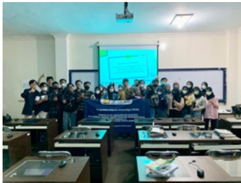
Gambar 6 Foto bersama mahasiswa prodi manajemen.