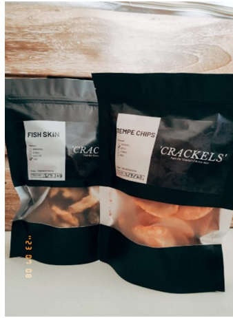
Gambar 4 Foto produk cemilan.