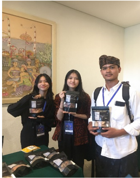
Gambar 2 Aktivitas diskusi bersama pelaku usaha.