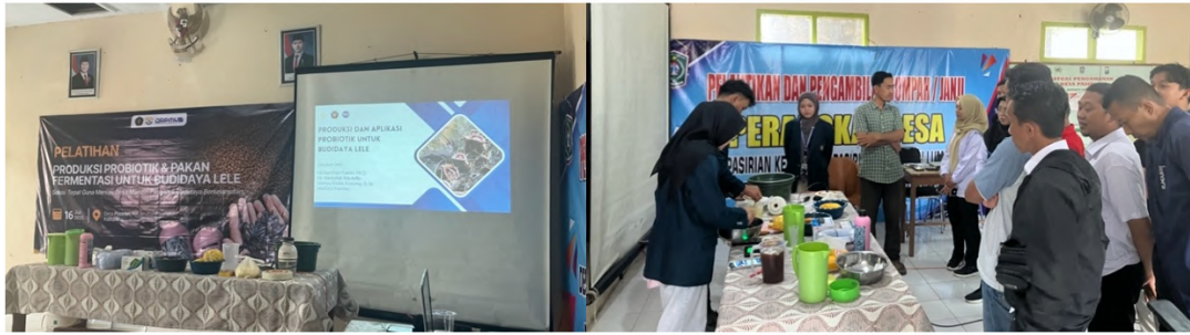
Gambar 3 Demonstrasi produksi probiotik dan pakan fermentasi.