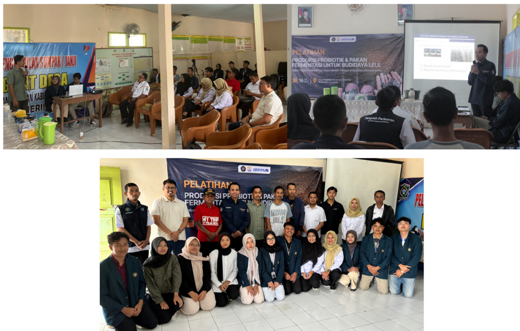
Gambar 2 Sosialisasi produksi probiotik dan pakan fermentasi di Balai Desa Pasirian, Kecamatan Lumajang.

Teknik learning by doing membuat peserta lebih mudah memahami tahapan produksi, mulai dari pencampuran bahan, proses fermentasi, hingga pengujian kualitas produk secara sederhana (aroma, tekstur, dan pencernaan). Peserta menunjukkan antusiasme tinggi, terlihat dari banyaknya pertanyaan yang diajukan serta keseriusan saat praktik. Beberapa peserta bahkan langsung berdiskusi tentang kemungkinan penggunaan bahan lokal lain yang tersedia di desa. Pendekatan praktik langsung ini terbukti efektif dalam meningkatkan kepercayaan diri peserta untuk memproduksi probiotik dan pakan fermentasi secara mandiri.