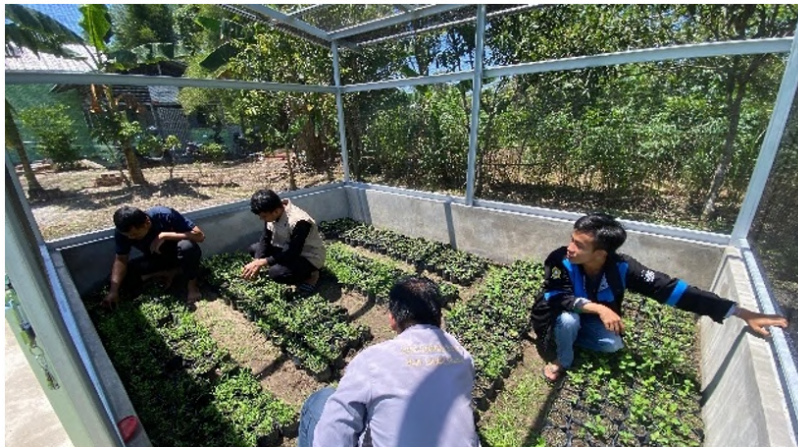
Gambar 5 Perbanyak bibit bidara di rumah tanaman.

Bibit tanaman bidara yang telah berumur 50 hari selanjutnya dilakukan penanaman di 350 halaman rumah warga desa sebagai wujud nyata dalam aksi konservasi. Kegiatan penanaman bibit bidara melibatkan warga desa sehingga secara luas warga desa berpartisipasi dalam keberlanjutan konservasi selain dengan adanya partisipasi tim konservasi toga bidara. Desa Pulau Semambu yang terdiri dari 6 dusun, jumlah tanaman bidara yang dilakukan penanaman secara merata di setiap dusunnya sekitar 58 bibit tanaman setiap dusunnya. Proses penanaman bibit bidara dapat dilihat pada Gambar 6.