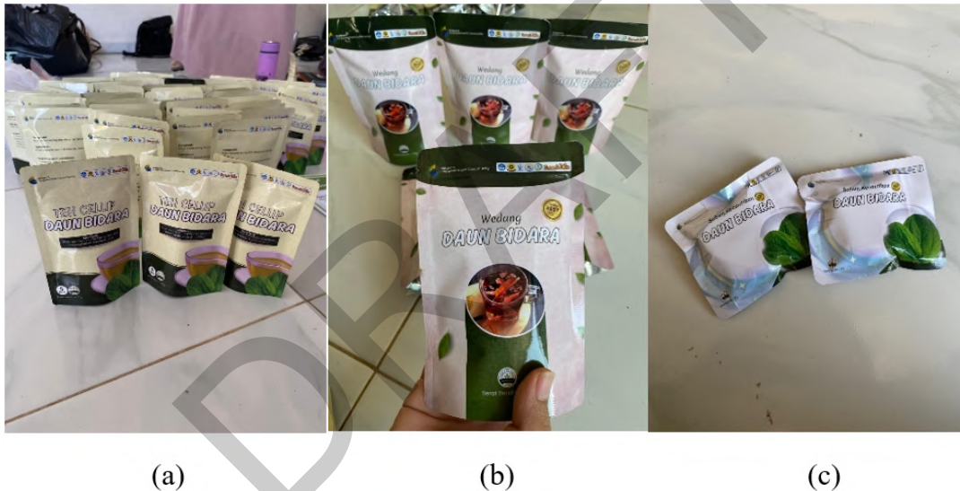
Gambar 8 Kemasan produk herbal bidara; (a) teh celup bidara, (b) wedang bidara, (c) sabun bidara.

Proses monitoring dan evaluasi melalui interaksi dan diskusi bersama tim toga bidara terhadap program yang telah dijalankan serta memetakan hambatan dan tantangan untuk keberlanjutan program. Beberapa hambatan yang terjadi di antaranya unsur permodalan untuk pengembangan usaha, ketersediaan rumah produksi produk yang tentatif dan tantangan oleh tim konservasi seperti proses sertifikasi produk. Pengembangan usaha dapat dilakukan melalui komersialisasi bibit tanaman bidara sehingga desa Pulau Semambu dapat menjadi sentra tanaman bidara di Sumatera Selatan. Respons masyarakat desa Pulau Semambu terhadap kegiatan ini secara umum sangat baik. Dari sejumlah 20 orang warga yang tergabung dalam tim konservasi Toga Bidara, sejumlah 80% anggota kelompok menyatakan bersedia secara berkala untuk memproduksi produk toga bidara dalam bentuk teh celup daun bidara, sejumlah 60% anggota kelompok tertarik untuk memproduksi sabun kesehatan dari daun bidara secara mandiri dan sejumlah 100% anggota kelompok akan melakukan upaya perbanyakan atau pembibitan tanaman bidara di halaman pekarangan rumah. Lebih lanjut anggota kelompok bersedia melakukan komersialisasi bibit tanaman dan produk herbal dari daun bidara untuk menambah pendapatan keluarga.