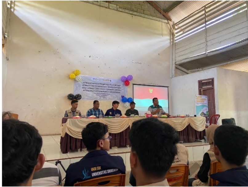
Gambar 9 Prosesi peresmian tim konservasi toga bidara oleh pemerintahan desa.