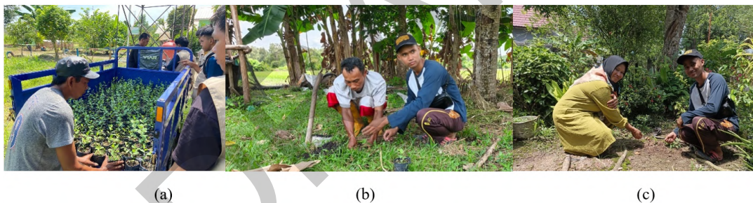
Gambar 6 Penanaman bibit bidara di desa; (a) pengangkutan bibit, (b) lokasi warga dusun 2, (c) lokasi warga dusun 5.

Bibit tanaman bidara yang telah berumur 50 hari selanjutnya dilakukan penanaman di 350 halaman rumah warga desa sebagai wujud nyata dalam aksi konservasi. Kegiatan penanaman bibit bidara melibatkan warga desa sehingga secara luas warga desa berpartisipasi dalam keberlanjutan konservasi selain dengan adanya partisipasi tim konservasi toga bidara. Desa Pulau Semambu yang terdiri dari 6 dusun, jumlah tanaman bidara yang dilakukan penanaman secara merata di setiap dusunnya sekitar 58 bibit tanaman setiap dusunnya. Proses penanaman bibit bidara dapat dilihat pada Gambar 6.