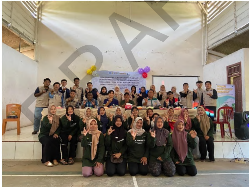
Gambar 10 Dokumentasi tim toga bidara desa Pulau Semambu, perangkat desa dan tim pengabdian.