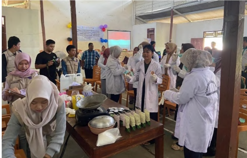
Gambar 7 Pendampingan produksi produk herbal bidara.