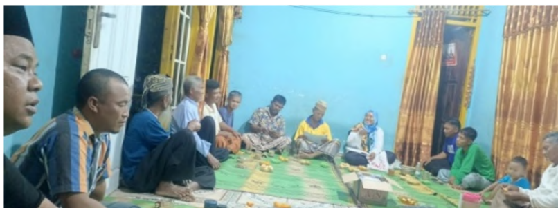
Gambar 2 Sosialisasi di rumah warga desa.