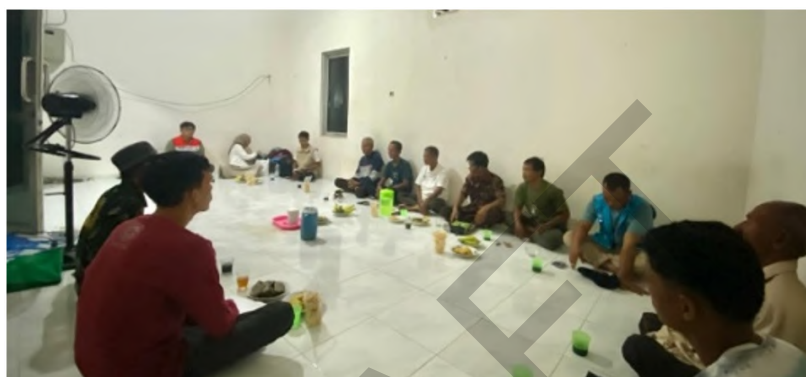
Gambar 3 Sosialisasi di gedung gapoktan.

Sosialisasi yang dilakukan kepada masyarakat menghasilkan tindak lanjut dalam program pelatihan dan pembibitan tanaman bidara menggunakan rumah tanaman yang dilakukan secara gotong-royong. Program pelatihan dilakukan di kantor desa dan pembibitan tanaman bidara dilakukan di rumah tanaman di lahan milik desa. Sejumlah 350 bibit tanaman bidara dibudidayakan menggunakan media tanaman polybag di rumah tanaman dengan ukuran luas 3x4 meter persegi. Bibit tanaman bidara berasal dari biji tanaman yang diperoleh dari buah tanaman bidara yang sebelumnya telah tumbuh di rumah warga desa. Kegiatan pelatihan dan perbanyakan bibit tanaman bidara dapat dilihat pada Gambar 4 dan 5.