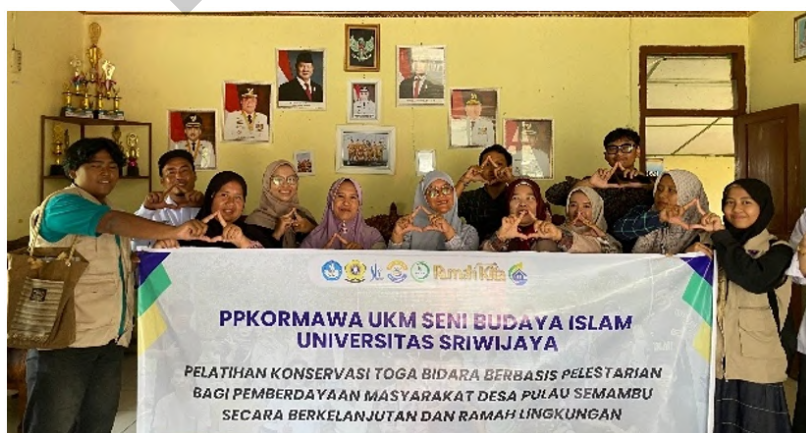
Gambar 4 Pelatihan oleh tim UKM SBI di kantor desa.

Sosialisasi yang dilakukan kepada masyarakat menghasilkan tindak lanjut dalam program pelatihan dan pembibitan tanaman bidara menggunakan rumah tanaman yang dilakukan secara gotong-royong. Program pelatihan dilakukan di kantor desa dan pembibitan tanaman bidara dilakukan di rumah tanaman di lahan milik desa. Sejumlah 350 bibit tanaman bidara dibudidayakan menggunakan media tanaman polybag di rumah tanaman dengan ukuran luas 3x4 meter persegi. Bibit tanaman bidara berasal dari biji tanaman yang diperoleh dari buah tanaman bidara yang sebelumnya telah tumbuh di rumah warga desa. Kegiatan pelatihan dan perbanyakan bibit tanaman bidara dapat dilihat pada Gambar 4 dan 5.