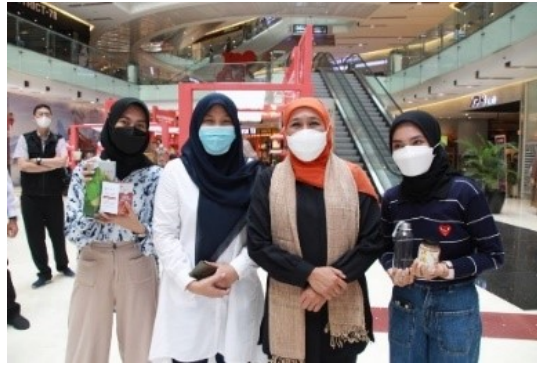
Gambar 6 Pendampingan UMKM dalam pameran K-KUM yang dihadiri oleh Gubernur Jawa Timur.

melakukan beberapa pendampingan dalam riset konten, desain feed dan story Instagram, copywriting , riset hashtag , menyediakan admin posting dan reporting . Selain itu, tim ITS juga melakukan pelatihan bersama pihak Sociodigio terkait social media marketing . Pelatihan ini dilakukan selama 4 bulan dengan materi meliputi: digital audit , sales and inventory planning , rancangan konten Instagram, Facebook, dan WhatsApp (termasuk copywriting dan hashtag ), setting up sosial media (manual and automatic tools ), rancangan konten dan pengaturan marketplace hingga evaluasinya. Sebagai tambahan, materi pelatihan juga membahas cara pengembangan bisnis online menggunakan iklan organik dan berbayar, meliputi: content planning websitellanding page ; setting up website/landing page , Google My Business , IG Ads dan Ads for Marketplace ; CRM Dbase Customer hingga hasil dan evaluasinya.