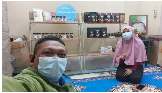
Gambar 4 Pendampingan sertifikasi Halal pada UMKM Bhumi Cantya Indonesia di Desa Bangah, Gedangan, Sidoarjo.

akan pentingnya dan manfaat dari sertifikasi halal bagi produk-produk mereka. Sehingga, dengan kampanye GEMESH ini diharapkan kedepannya UMKM binaan akan menggandeng UMKM lain sehingga semakin banyak UMKM yang mengajukan sertifikasi halal agar produk mereka lebih unggul dalam bersaing.