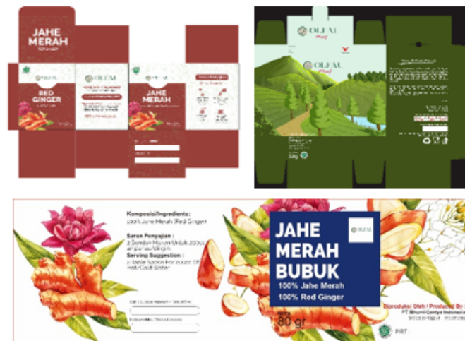
Gambar 5 Desain packaging produk Bhumi Cantya Indonesia.

Tim Abmas membantu UMKM dalam rebranding terhadap packaging produk untuk menambah kesan estetik terhadap citra produk UMKM Bhumi Cantya Indonesia dengan desain yang lebih elegan. Hal ini dilakukan untuk menciptakan kesan baru yang lebih menarik bagi konsumen. Disamping itu, UMKM ini mengikuti beberapa pameran untuk mempromosikan produknya agar lebih dikenal oleh masyarakat luas. Beberapa pameran yang pernah diikuti diantaranya PaDi virtual Expo dan K-KUM Expo 2021 . Pada tanggal 15-19 September 2021 UMKM binaan membuka booth stand di Grand City Mall Surabaya dalam event pameran K-KUM Expo 2021 . Pameran ini adalah kegiatan yang bertujuan untuk mendukung program pemerintah pusat dalam pemulihan ekonomi dan kebangkitan ekonomi nasional melalui promosi dan kolaborasi antara Koperasi dan UMKM sebagai ujung tombak ekonomi kerakyatan. Rangkaian acara dalam pagelaran ini yaitu talkshow , workshop , fashion show dan cooking class .