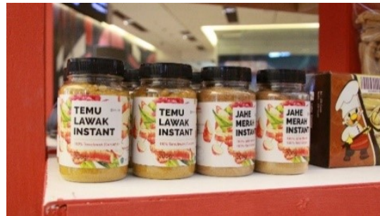
Gambar 2 Contoh produk dari UMKM Bhumi Cantya Indonesia.

Cantya Indonesia dan mahasiswa pendamping secara daring selama 6 hari pada tanggal 2-7 Agustus 2021 dengan 4 jam materi per hari melalui aplikasi teleconference zoom meeting .