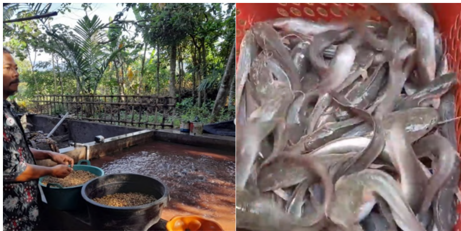
Gambar 1 Peternak Lele Lamigot YS Farm

Namun, beberapa peternak ikan lele mengeluhkan tentang mahalnnya harga pelet pakan ikan, terutama peternak yang beroperasi dalam skala kecil dan menengah, seperti UMKM Lamigot YS Farm yang berlokasi di Dusun Jeding, Desa Sumber Pinang, Kecamatan Pakusari, Kabupaten Jember, Jawa Timur (Gambar 1). Lamigot YS Farm sudah beroperasi sekitar 2 tahun. Seiring dengan pertumbuhan budidaya lele yang semakin pesat, Lamigot YS Farm menghadapi kendala dalam mendapatkan pelet pakan berkualitas tinggi dengan harga yang terjangkau.